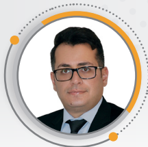
مهندس مسلم پسنده دانش آموزته مهندسی عمران